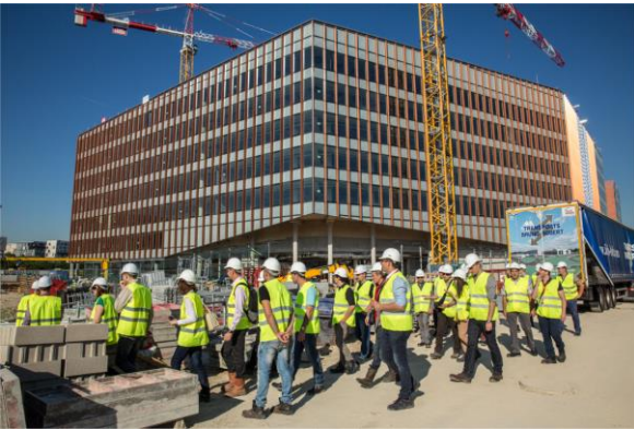
Formation jeunes managers : visite d'un chantier Goyer (Eiffage Métal)